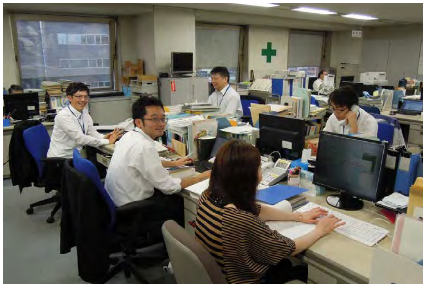
(北海道産業保安監督部の職場風景)