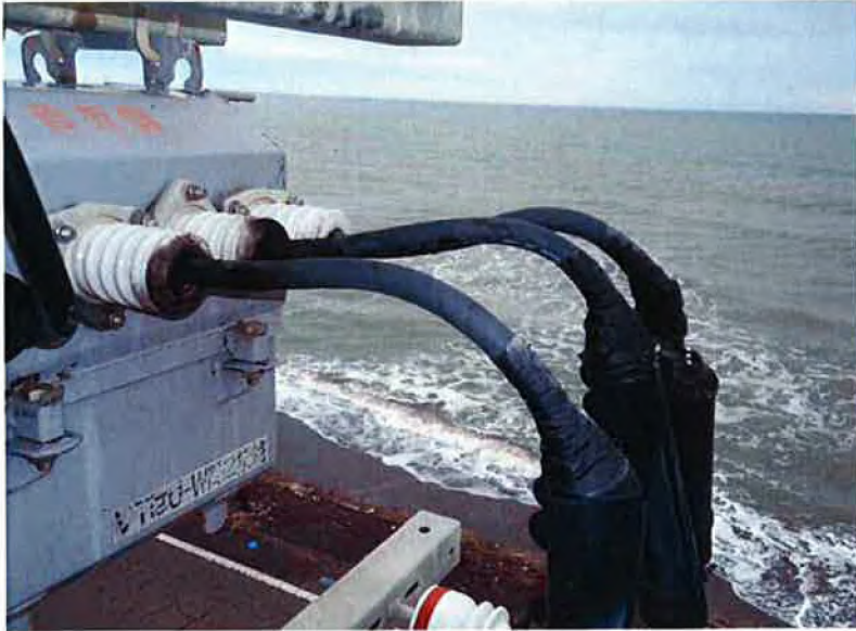
40号柱 高圧気中開閉器