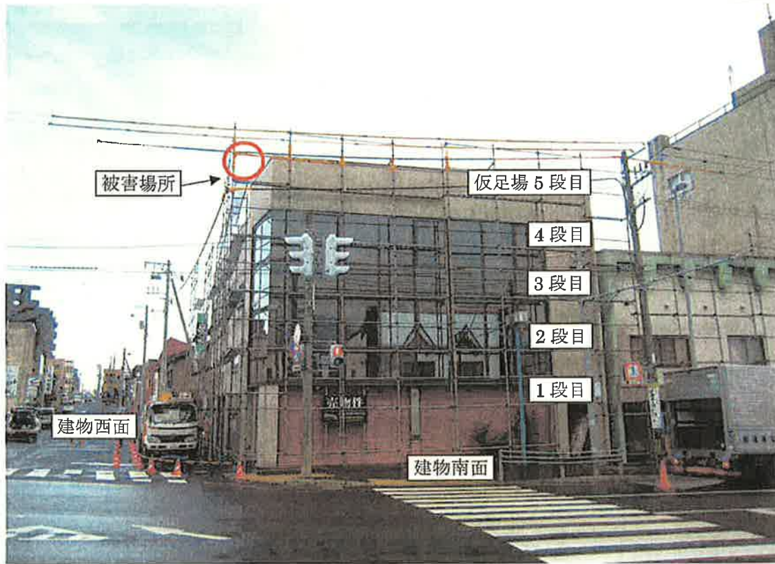
解体用仮足場 設置状況図